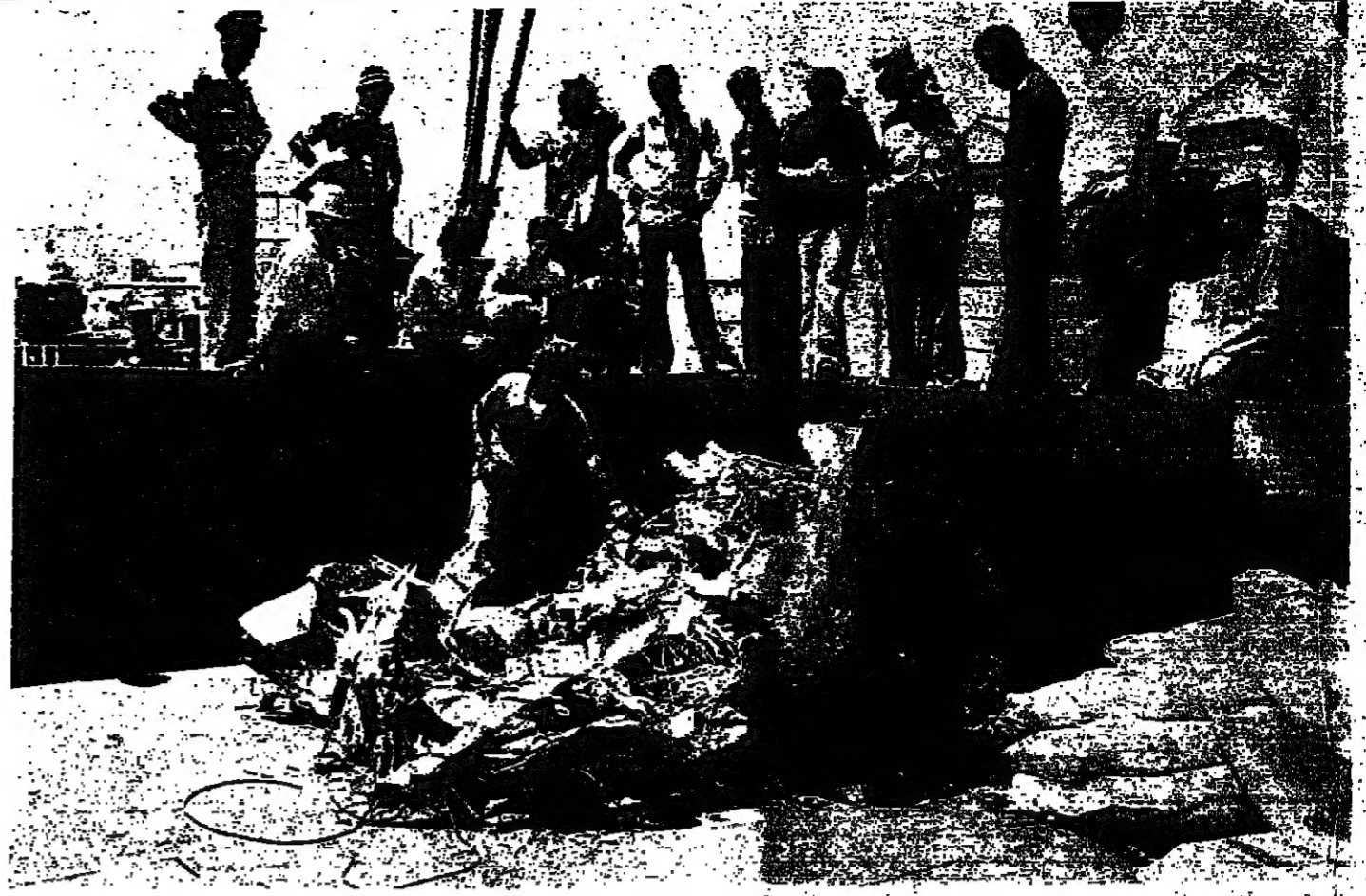
عمال في المراح حول حطام الطائرة بعد انتشاله الى احدى البواخر